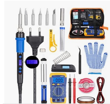
Exemple de Kit "fer à souder" sur amazon pour moins de 30€